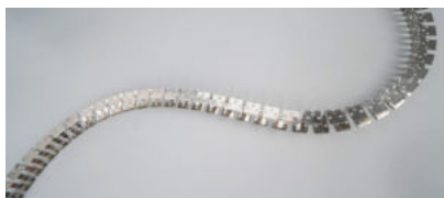
BIEGBARES GEZAHNTES PROFIL